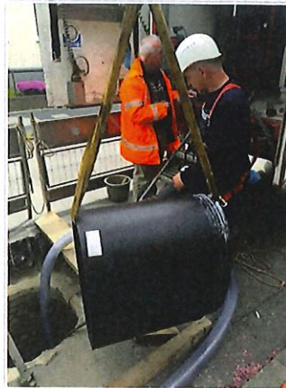
Einlass des Rohres in den Startschacht Introducing the pipe into the launch shaft

Insgesamt mussten 276 m Kanaltrasse mit nur zwei Einbaustandorten der Modulmontage im Schacht saniert werden; der längste Abschnitt von 176 m war mit nur einem Einschubvorgang zu bewältigen. Nach der Entscheidung, den Altkanal mit-