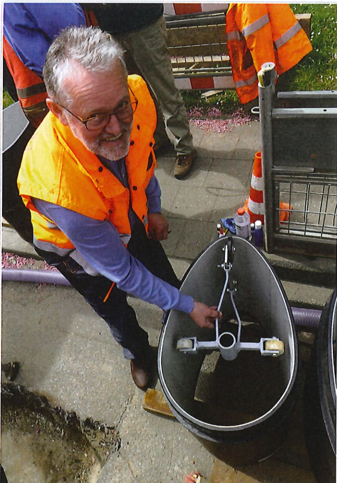
Kontrolle des Rohres vor dem Einschub Inspecting the pipe before insertion

All domestic service connections were opened by robots following pipe installation and re-connected using an injection sealing system.